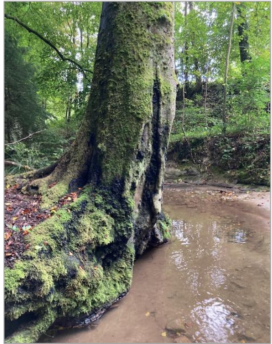
Figure 2 et 3 – Exemples d'arbres présentant un risque pour la sécurité des personnes et des biens