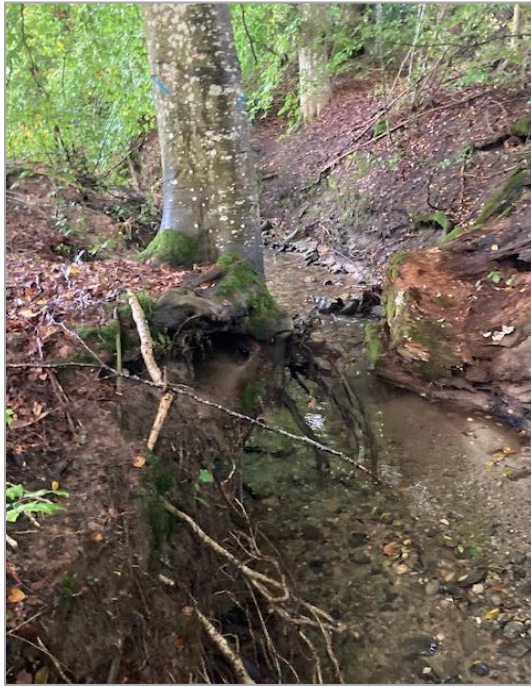
Figure 1 et 2 – Exemples d'arbres présentant un risque pour la protection contre les dangers naturels